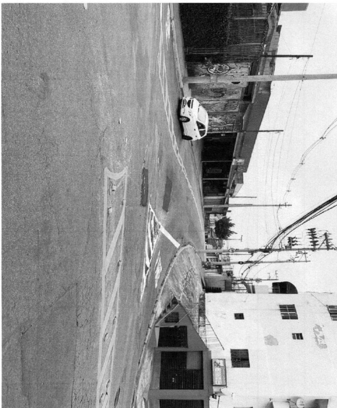
IMPLANTAÇÃO DE FAIXAS DE PEDESTRE NA RUA GAGO COUTINHO COM A RUA BENEDITO CARVALHO PINTO, JD. AEROPORTO III.